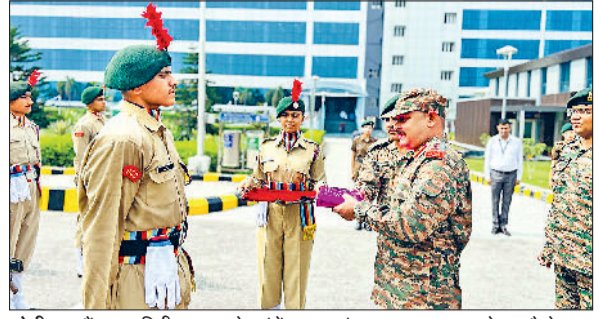
सोनीपत। कैप का निरीक्षण करने पहुंचे ग्रुप कमांडर का स्वागत करते हुए कैडेट्स।