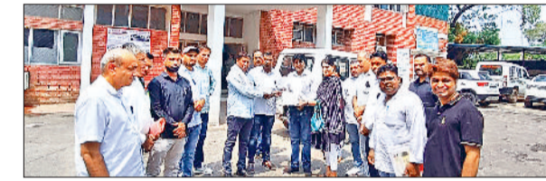
सोनीपत। अपनी मांगों का ज्ञापन सौंपते हुए कर्मचारी।