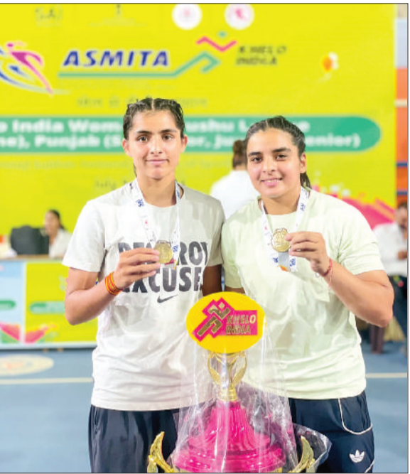
खरखोदा। विजेता खिलाड़ी अपने पदकों के साथ।