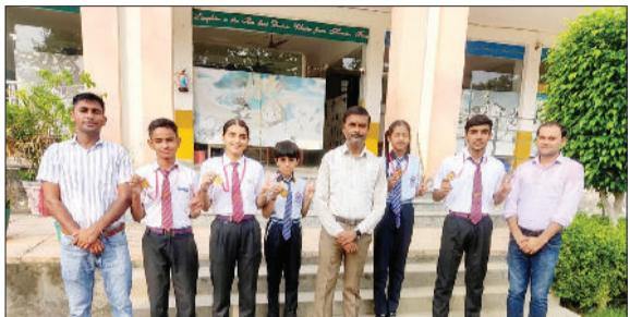
सोनीपत। विजेता प्रतिभागियों के साथ प्राचार्य एवं अन्य।